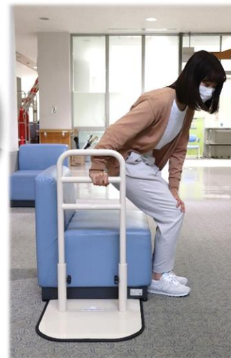
床置き型手すりの 使用イメージ