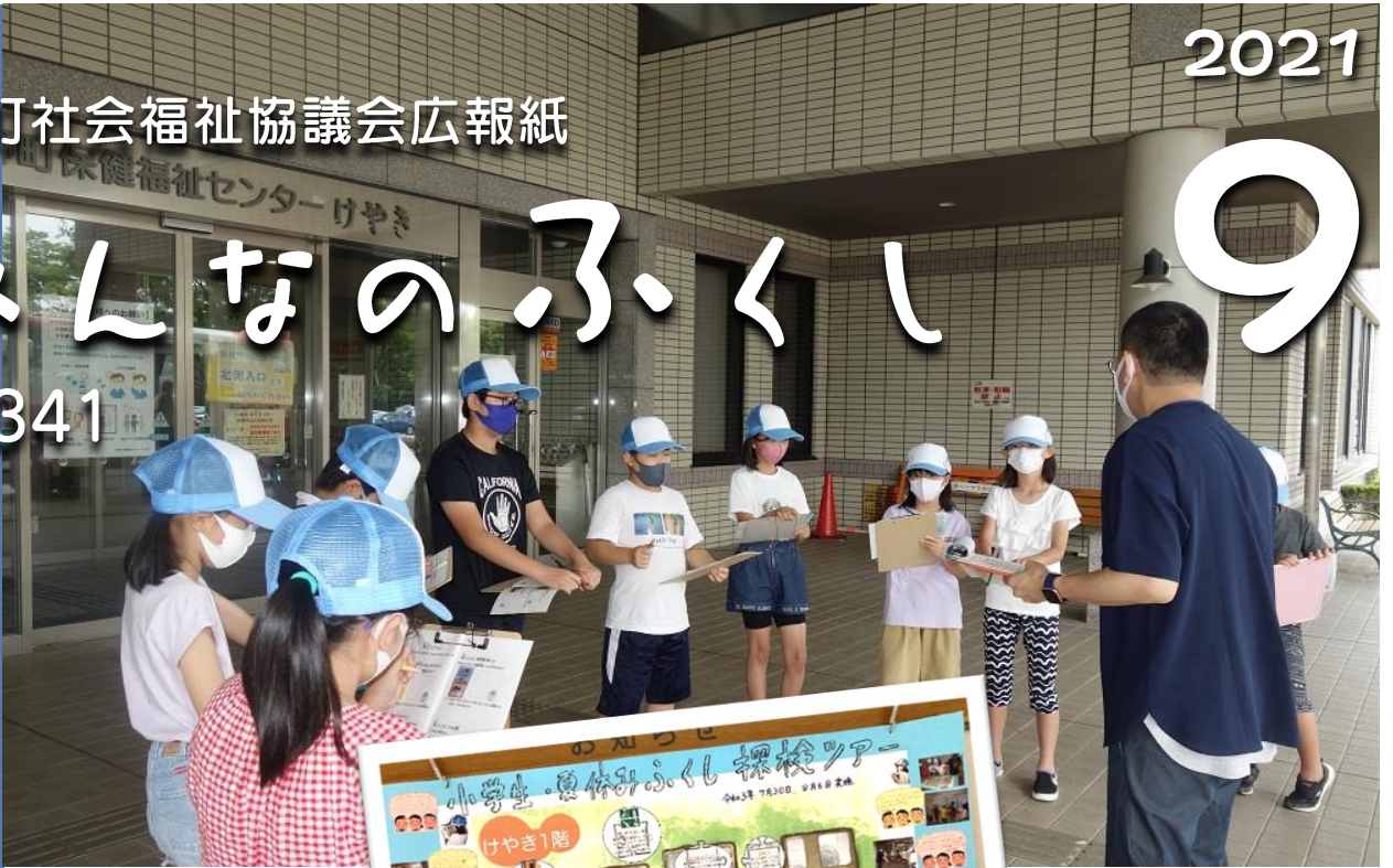
子どもたちみんなで