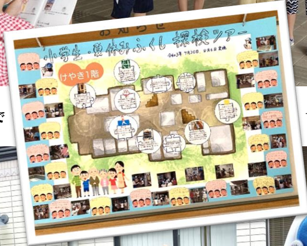
マップを制作しました