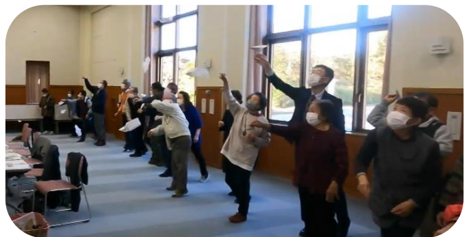
紙飛行機飛ばしの様子

人と人とが学び合う機会をもつことの大切さを再認識することができました。いなべ市ボランティア連絡協議会の皆さま、ありがとうございました！