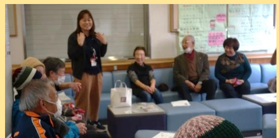
お茶のみ会の様子(コロナ禍以前の様子)