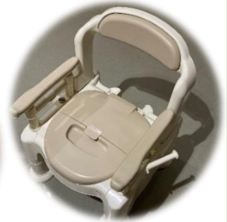
ポータブルトイレ