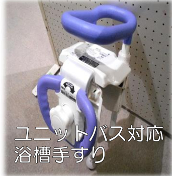
ユニットバス対応 浴槽手すり