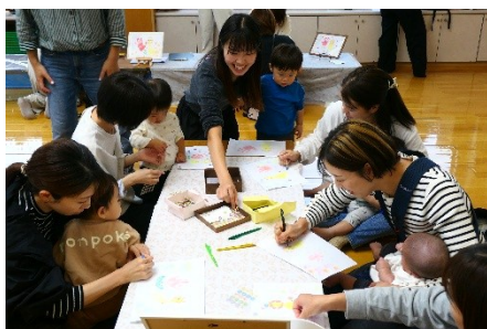
10月のこもっ子サロン「手形・足形アート」の様子